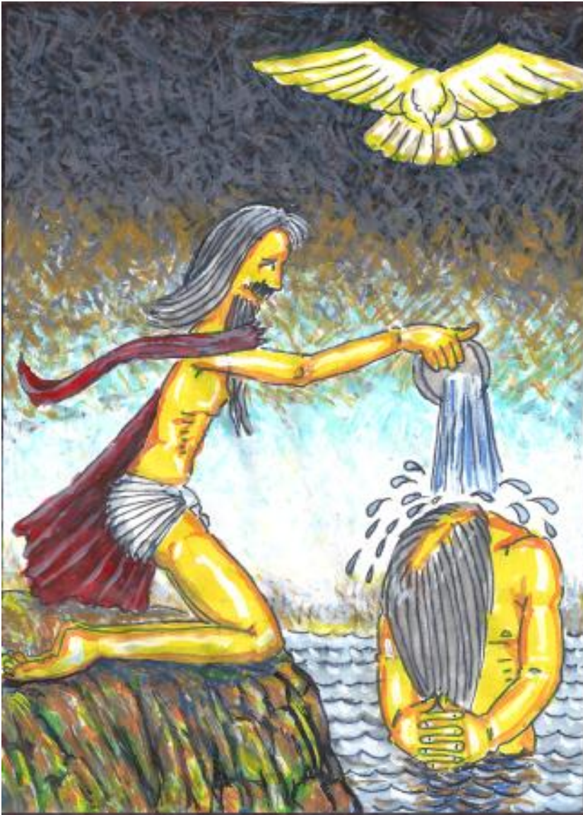
Matt. 3.16 – Mark. 1.10 – Luk. 3.22 – Joh. 1.32: "...Helligånden dalede ned over Ham i legemlig skikkelse, som en due..."